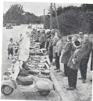
Da V. K. Randers fulgte V. K. Aarhus til døren og sagde tak for en dejlig fællestur til Rebild.