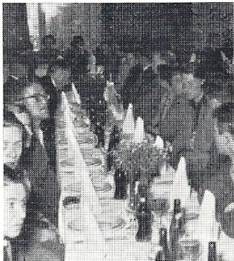
Et udsnit af deltagerne i „Dansk Vespdag“ i Odense parat til at gaa ombord i middagen.

Jeg fiskede hjelmen op fra gulvet; den var altid rar at have for alle tilfældes skyld.