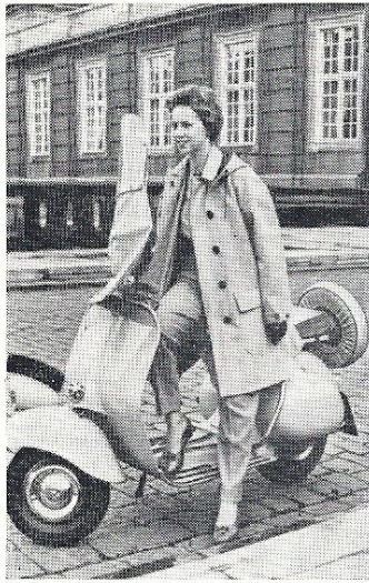
Thermo-frakken med det pragtfulde foer, der holder paa varmen, hvis man blot er varm, naar man kryber i frakken.