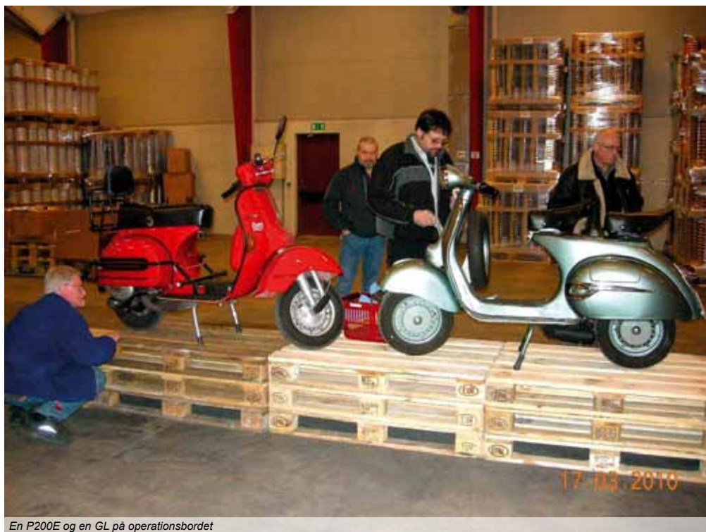
En P200E og en GL på operationsbordet