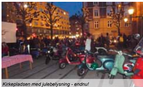
Kirkepladsen med julebelysning - endnu!

solen gik ned. En af deltagerne, ingen nævnt - ingen glemt, som altid synes at være sulten, købte for egen regning, stedets usandsynligt lækre sandwich: Laksefyldt Durumbolle, hvis omkreds næsten svarer til en middagstallerken, og han måtte så stå model til lettere, men godmodig mobning, for sin forslugenhed, især fordi vedkommende påstod, at han