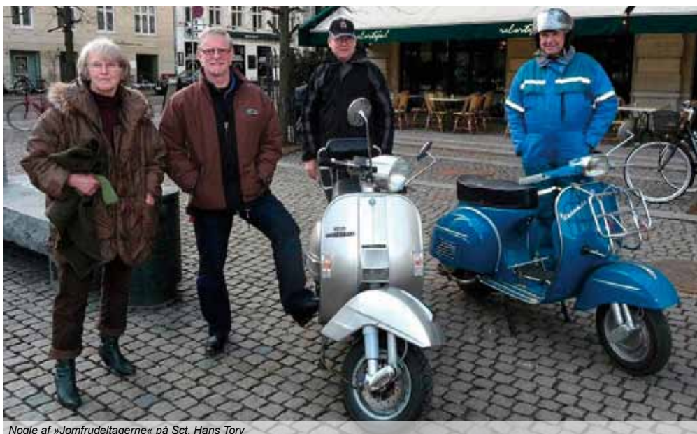
Nogle af »Jomfrudeltagerne« på Sct. Hans Torv