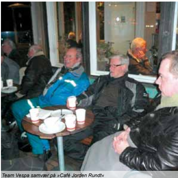
Team Vespa samvær på »Café Jorden Rundt«