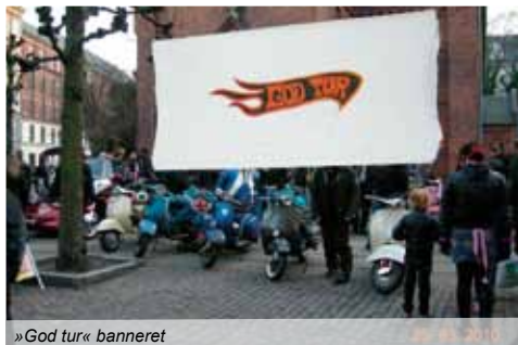
»God tur« banneret

4000 motorcykler, gik med at hilse på - og snakke med de kammerater, som vi ikke havde set i mange måneder, samt kikke på vore Vespa'er og de flotte, dyre motorcykler.