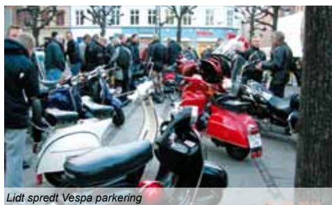
Lidt spredt Vespa parkering

Nogen af os synes, at »Bakken åbner«-turen, i det mindste går ud til Bellevue, før man kører til det sted, der er udset til at være turens endemål, hvilket igen i år blev Café "Jorden Rundt" i Charlottenlund. Som sædvanligt på denne dag er "Den Lille Runde Restaurant" stop fyldt med Bikere og almindelige mennesker, der traditionen