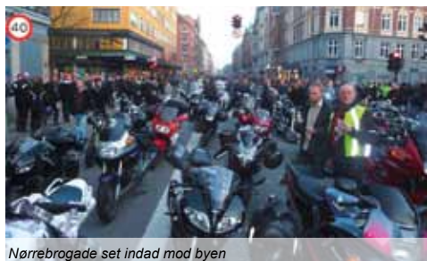
Nørrebrogade set indad mod byen

igen 4 - 5 meter længere fremme, og man stopper. Dette gentager sig indtil man er ude af selve Hellerup, og når frem til Charlottenlund, så får maskinerne »gas« og accelererer ud mod Klampenborg ad Vandstrandvejen og giver os på Vespa »Baghjul«, men da motorcykel-betjentene stadig er med, for at sikre at alle kører ordentligt, er det vigtigt at overholde hastighedsgrænsen, "så godt som muligt!"