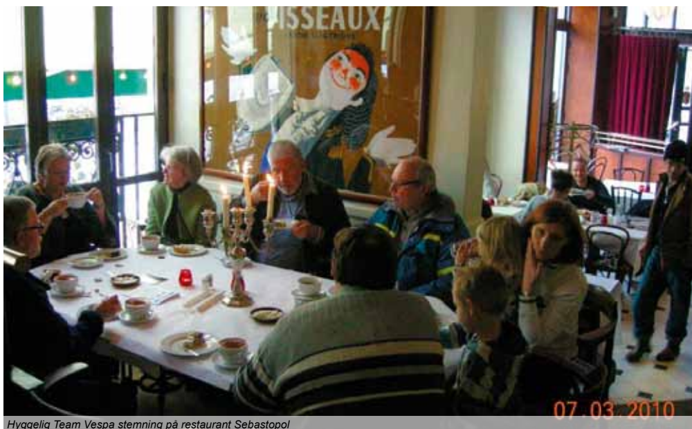
Hyggelig Team Vespa stemning på restaurant Sebastopol

Et par af deltagerne havde været igang med nogle af de gamle Vespa Journaler, helt fra 1963, så der blev filosoferet lidt over de mange typer aktiviteter, de mange klubber den-gang havde på programmet. Team Vespa havde f.eks. på weekend