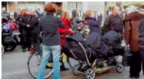
Næste generation af 2-hjulere?

os ude på restaurantens brede terrasse, og nyde både den friske aftenluft og strålevarmen fra flaskegasbrænderen. Der blev bestilt Kaffe og Kage, og serveringen med den varme kaffe bekom os godt, da temperaturen var dalet betragteligt siden