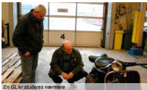
En GL'er studeres nærmere