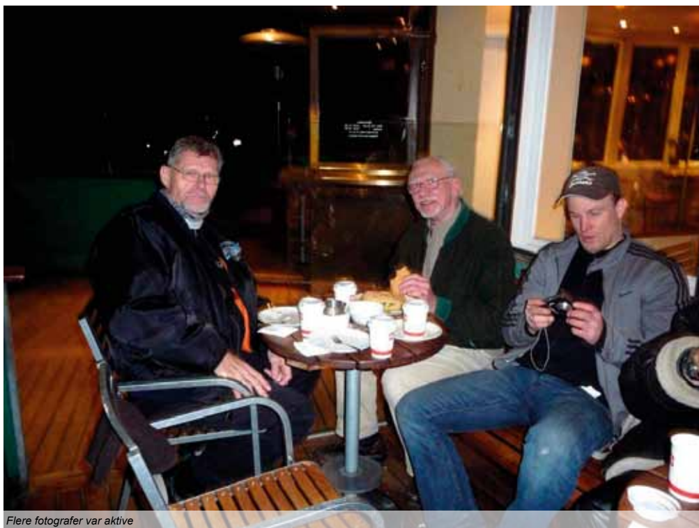
Flere fotografer var aktive