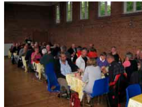
Stemningen var i top under Træfmiddagen og senere ved det amerikanske lotteri.