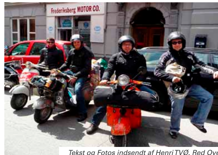
Tekst og Fotos indsendt af Henri TVØ. Red Ove

Under den hyggelige samtale, som Henri havde med italienerne, blev det klart, at de 4 seje Vespakørere havde taget turen helt fra Triest til det store Vespa World Days Træf i Norge, og nu var på vej tilbage til Triest. En af Vespaerne var imidlertid gået i stykker, og italienerne havde fundet frem til Frederiksberg Motor co. hvor Frank fik klaret de tekniske problemer. Men, stor respekt, virkelig noget af en langtur på Vespa, Triest/Norge/Triest.