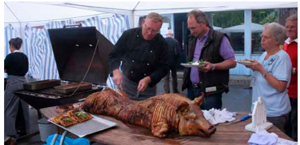
God afsætning for "Det lækre Svin."

havde i hvert fald udset sig nogle fine ting- og vandt også en af de store gevinster: En skoletaske fra Haribo, som hun dog nok mente, var bedre placeret hos den lille sidevognsgæst fra Sverige, hvad den også var. Det blev en meget vellykket aften, som sluttede med et godt udkørt køkkenhold.