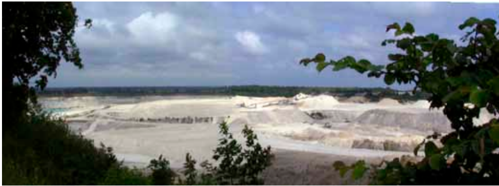
Det helt store Panorama vue over Faxe Kalkbrud.