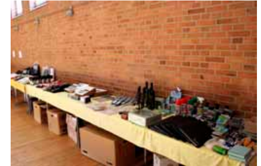
Præmiebordet for det amerikanske lotteri.