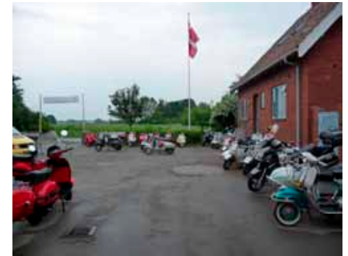
Et skønt syn med de mange Vespaer.