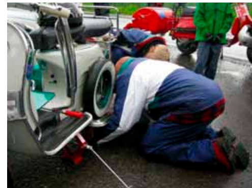
En "svensk" punktering, ingen problem Hurtigt klar igen.