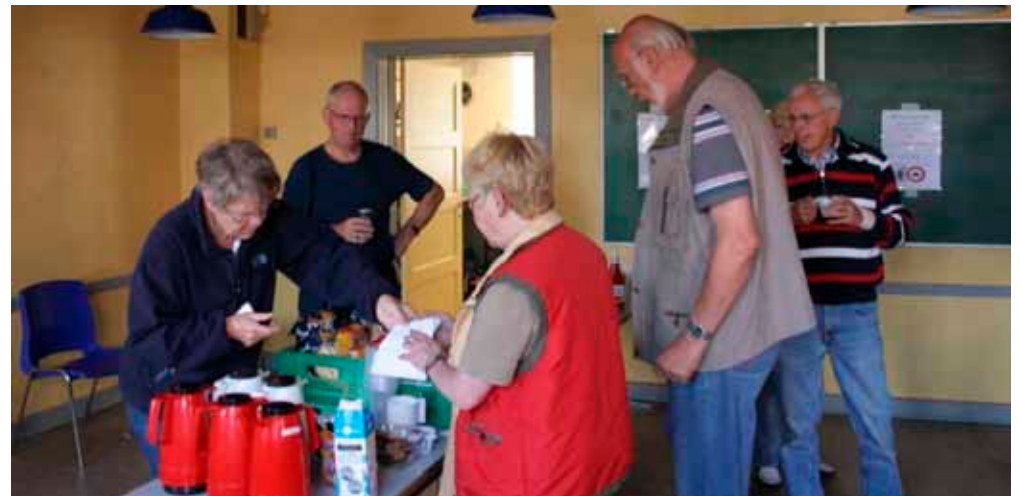
Køkkenholdet i funktion med salg af diverse gode fastfood tilbud.