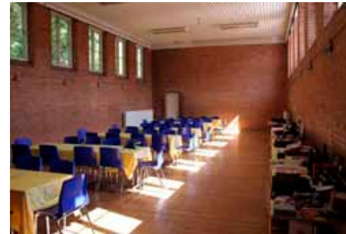
Den gamle "gymnastiksal" klar til at tage imod middagsgæsterne.