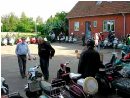
"Mønstring" i gården før aftenuren.