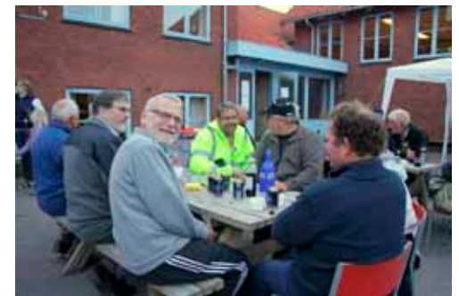
Afslappet og hyggelig stemning i "Den gamle skolegård" på FDF center Sjælland.