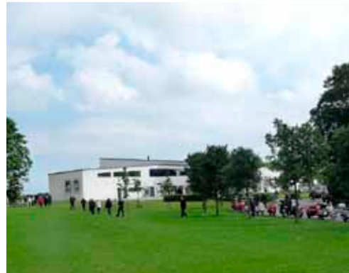
Geomuseet som flot "baggrund" for kaffepausen i Faxe.

Men hvad betyder regn, når vi kunne sætte os ind ved et veldækket bord i en tør gymnastiksal, og der, efter en introduktion af kokken, var den mest lækre mad.