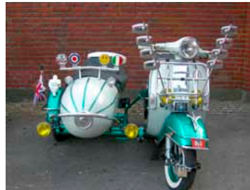
"Mod" Vespa helt fra Stockholm.