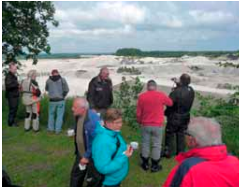
Alle deltagere tog et kig udover kalkbruddet.