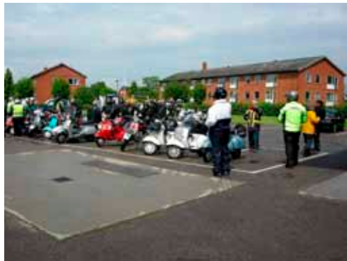
Der blev fyldt godt op med Vespaer ved OK tanken i Faxe.